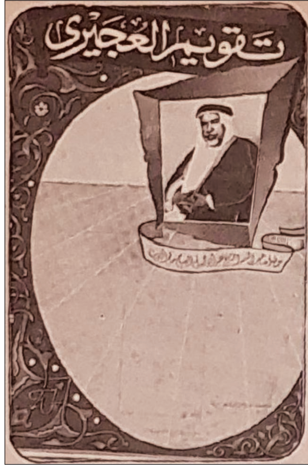
• صورة لأول تقويم صدر لصالح العجيري عام ١٩٥٢م