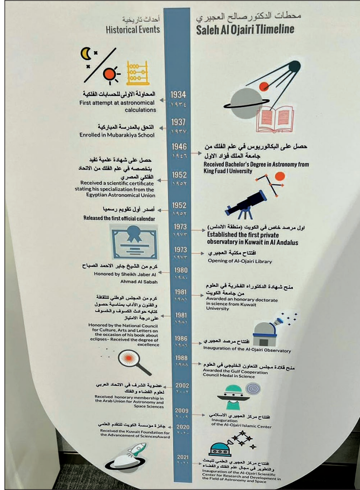
● لوحة في مركز العجيري العلمي تلخص محطات حياته