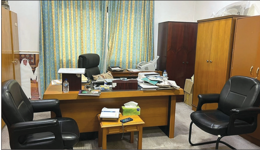
● مكتب الدكتور صالح العجيري رحمه الله في مركز العجيري العلمي