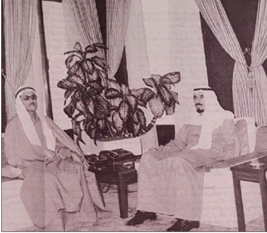
● الدكتور صالح العجيري - رحمه الله - مع سمو الأمير الراحل الشيخ جابر الأحمد الصباح