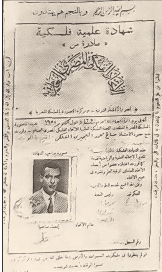
● صورة لشهادة الاتحاد الفلكي المصري العام عام ١٩٥٢م