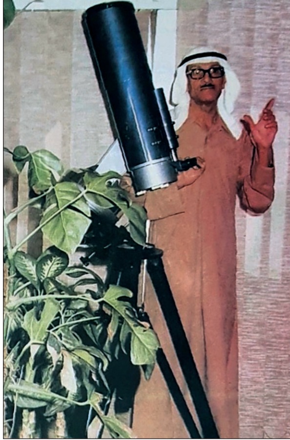
• دكتور صالح العجيري