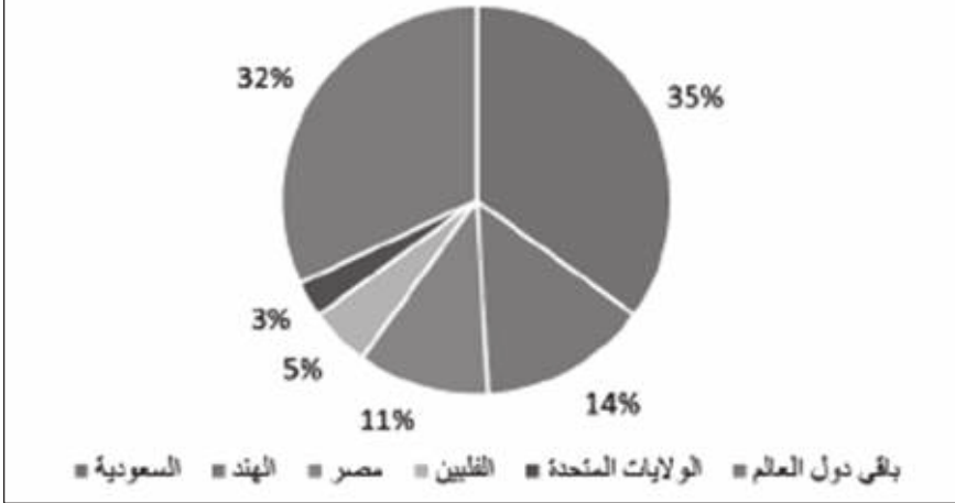
شكل (3) التوزيع النسبي للمسافرين الوافدين إلى الكويت حسب الدولة خلال عام 2018